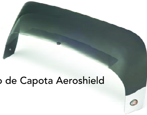
Escudo de Capota Aeroshield