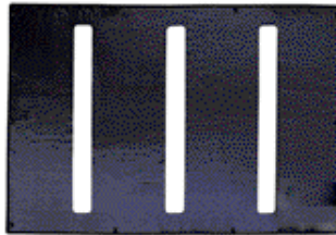
Cubiertas para el Invierno